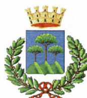
Comune di Somma Ves.na