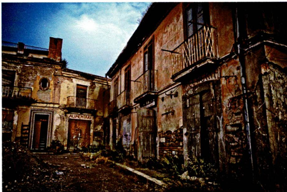
Apice, città Fantasma

Museo e Biblioteca di Ornitologia, Castello dell'Ettore, Borgo Medioevale , "Città Fantasma"