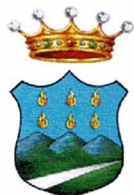
Comune di Apice BN